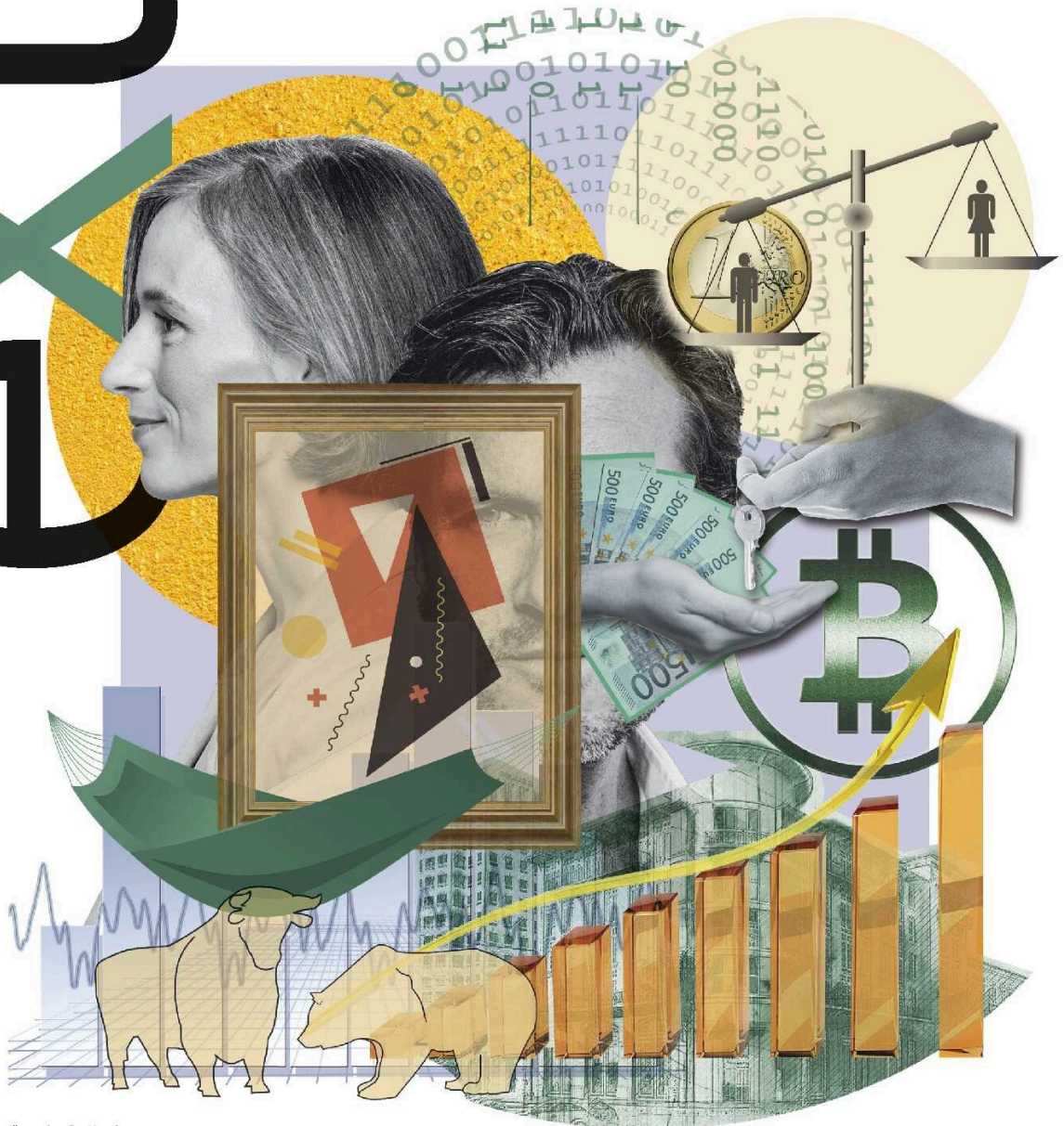
Illustration: Eva Vasari